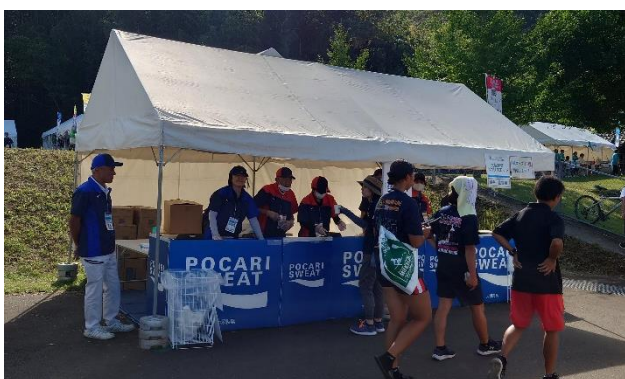
ベスト、帽子 (鹿屋市)