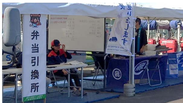
弁当引換所（鹿屋市）