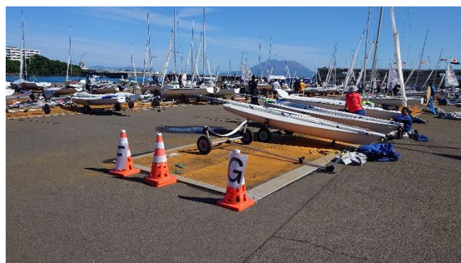
ディンギーバース（艇置場）