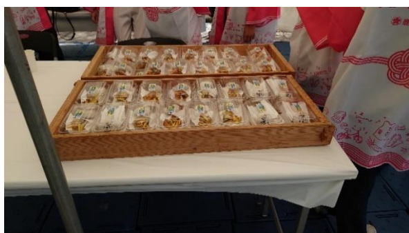
ガネ天・かるかんふるまい（鹿屋市）