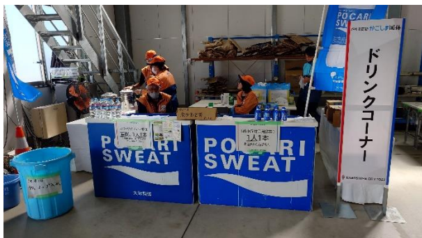
ドリンクコーナー（鹿児島市）