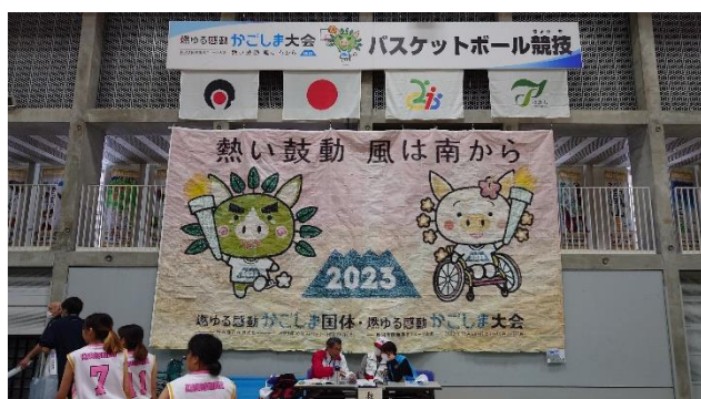
歓迎装飾（モザイクアート）