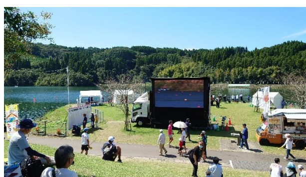
ビジョンカー中継