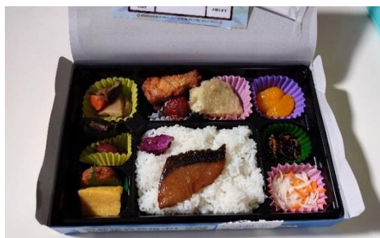
カンパチ弁当（鹿児島市）