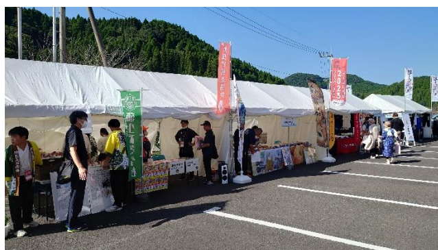
ふるまいコーナー・売店