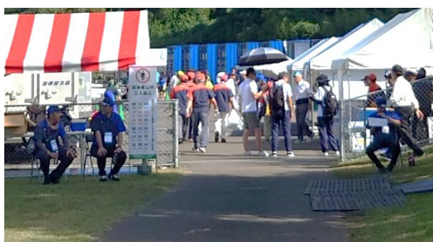
A Dカードチェック（鹿屋市）