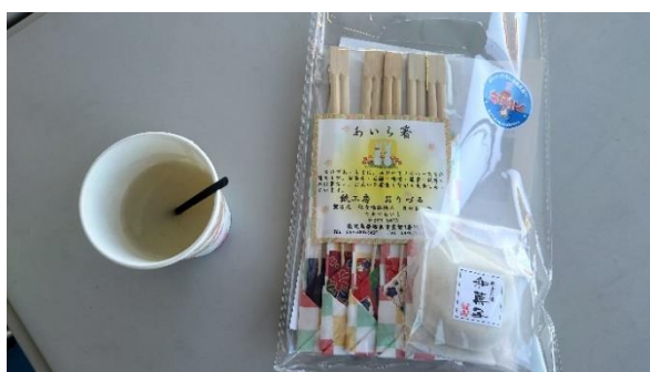
茶ぶし味噌・かるかん・箸ふるまい（始良市障スポ）