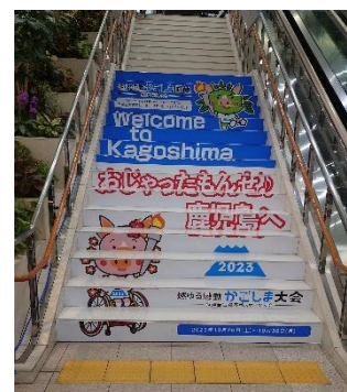
階段装飾 (鹿児島空港)