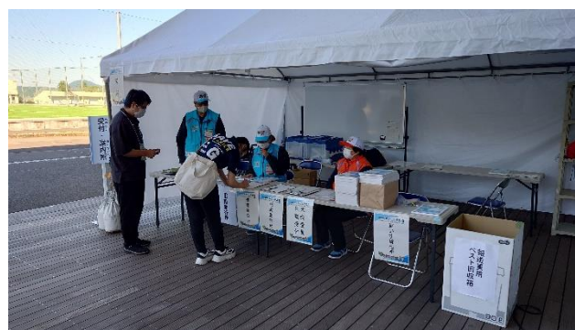
受付・案内所（関係者用）