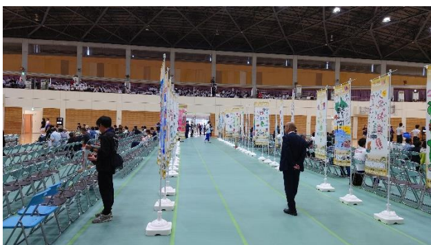
手作りのぼり旗 (始良市)