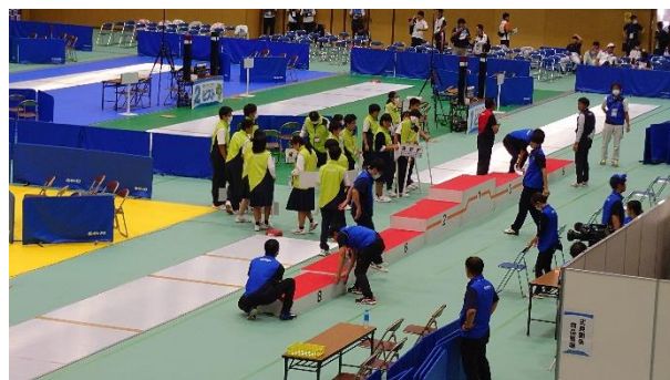
表彰式準備（垂水市）