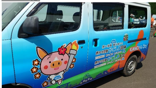
実行委員会車両（鹿屋市）