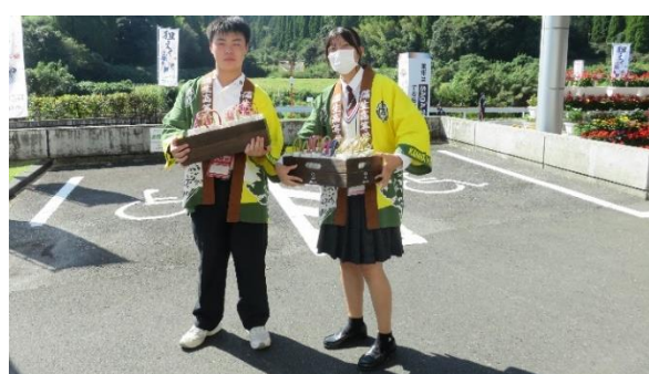
高校生によるふるまい（始良市）