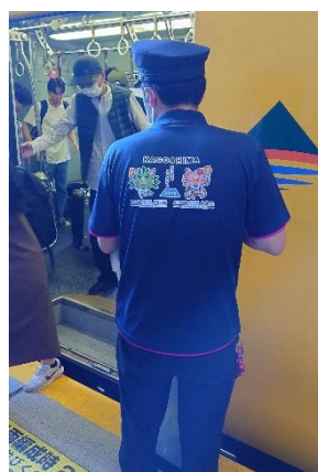
国体ポロシャツ着用駅員（鹿児島市）