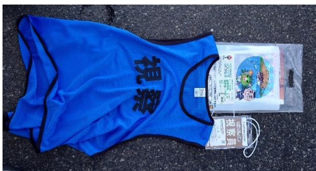
視察員用ベスト (鹿児島市)