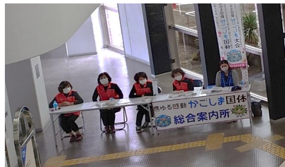
総合案内所（垂水市）