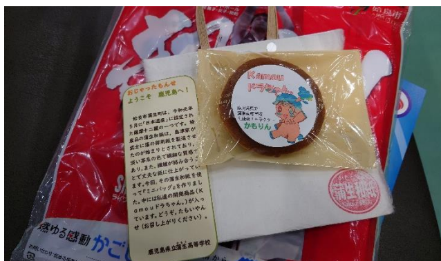
ふるまい品（どら焼き、蒲生和紙バッグ）