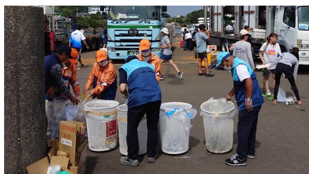
環境美化（鹿児島市）