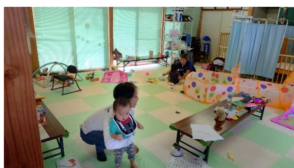
チャイルドルーム