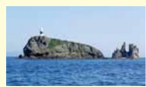
鯛島 脇野沢の沖合にぼつんと浮かぶ、鯛が泳いでいるように見える無人島。近くの愛宕山公園からは陸奥湾と鯛島を一望できます。

「ホタテ」や「海峡サーモン」といった海の幸だけでなく、むつ市にはブランド牛の「下北牛」や「一球入魂かぼちゃ」「夏秋いちご」など大地の恵みもたくさんあります。さらにご当地グルメの「大湊海目カレー」「大湊Sora空っ」もオススメです。