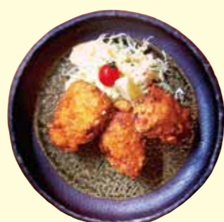
むつ市のうまいは 日本一！（食）

「ホタテ」や「海峡サーモン」といった海の幸だけでなく、むつ市にはブランド牛の「下北牛」や「一球入魂かぼちゃ」「夏秋いちご」など大地の恵みもたくさんあります。さらにご当地グルメの「大湊海目カレー」「大湊Sora空っ」もオススメです。