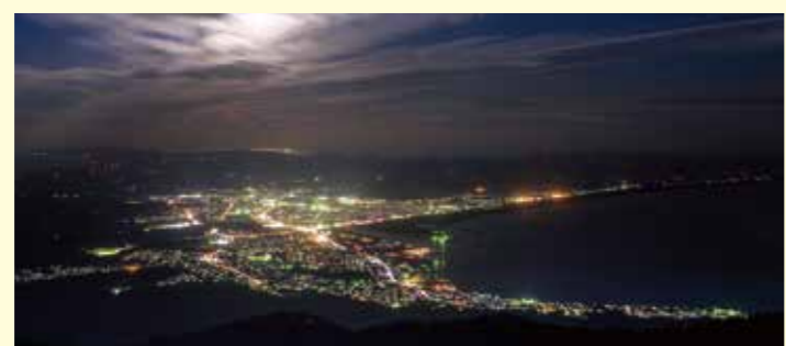
下北最高峰「釜臥山」 下北半島の中央にそびえる標高878mの釜臥山。その頂上付近の展望台からは、北に北海道、南に陸奥湾を挟んで八甲田山や岩木山が望める360度の大パノラマ。夜には「光のアゲハチョウ」と称されるむつ市街の美しい夜景を堪能できます。

「下北最大の夏祭り」「田名部祭り」 県の無形民俗文化財に指定され、370年以上の歴史を持つと言われる田名部まつり。8月18日から20日までの期間中には、豪華絢爛な5台の山車が市内を練り歩きます。最終日には山車が勢揃いし「五車別れ」が行われ、来年の再会を誓います。哀愁を帯びた祇園囃子を聴きながら、下北の短いながらも暑い夏を味わえます。