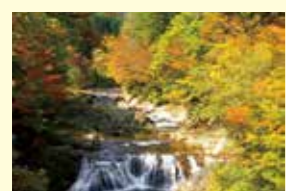
川内川溪谷 川内地区にある下北一の水量を誇る溪谷。溪谷に沿った遊歩道もあり、散歩が楽しめます。