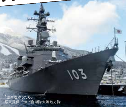
「護衛艦ゆうだち」

大湊海自カレーとは、海上自衛隊大湊基地に所属している各部隊のカレーのレシピを、実際に部隊でカレーを作っている調理員から市内の飲食店等に伝授いただき、各部隊の司令・艦長から味の認定をいただいている、むつ市のご当地グルメです。