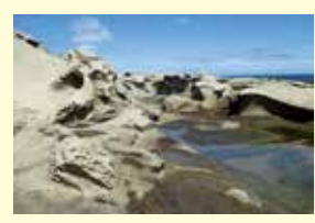
ちぢり浜 大畑地区にある、多様な生きものがくらす岩石海岸。波で削られてきた海食地形が見られます。

むつ市は、本州最北端の下北半島に位置しており、津軽海峡、平館海峡、陸奥湾の3つの海に囲まれ、「陸奥湾ホタテ」「海峡サーモン」など海の食材が豊富にあります。市の面積の多くが下北半島国立公園に指定されており、日本三大霊場の「恐山」や、「薬研」「湯野川」に代表される温泉、国の天然記念物である「北限のサル」など、自然の恵み豊かな街です。 また、むつ市を含む下北半島5市町村は、「大地・生態系・人々の営み」のつながりを学び、楽しむ日本ジオパークに認定され、平成28年9月に「下北ジオパーク」が誕生しました。