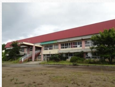
旧第一川内小学校