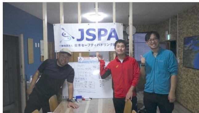
SUP ベーシックインストラクター検定～八戸蕪島海水浴場(11月3日～11月4日)