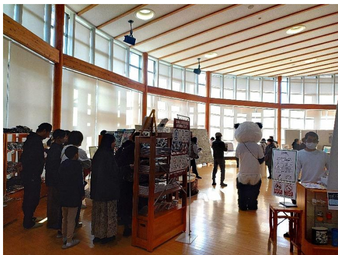
GOMA展 KAWAUCHI フィナーレイベント (11月23日～10月24日)