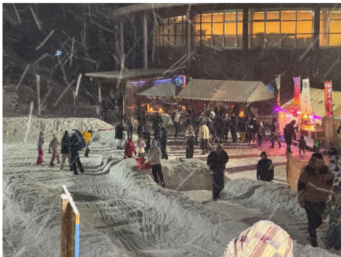
スノーライトフェス 2025 in 川内 【2月1日(土)】

2月度は、1月に準備を進めてきた「スノー×ライトフェス 2025 in 川内」が開催された。様々な人の協力もあり大成功に終わることができた。また「地域おこし協力隊全国サミット」に見学しに行き、他の協力隊の話しを聞くことや、意見を交換することができた。また今後の事業や活動のため、水産事務所主催の水産教室を見学させて頂いたり、「青森地域フォーラム」に参加させてもらえたりなど勉強になった月でもあった。