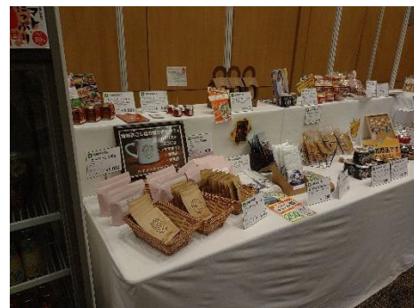
地域おこし協力隊全国サミット 【2月9日(日)】