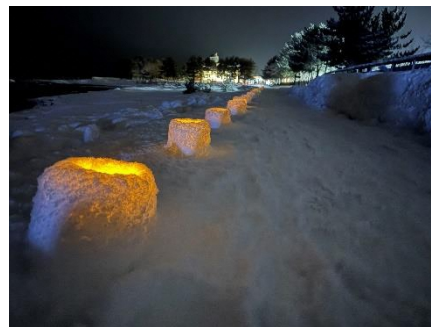
スノーライトフェス 2025 in 川内 【2月1日(土)】