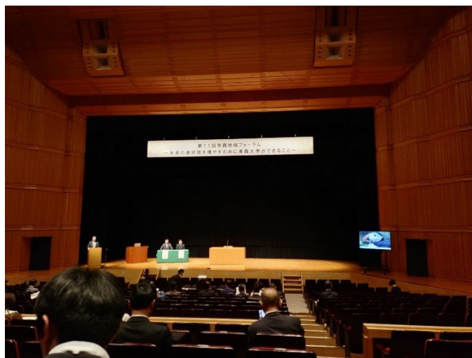
青森地域フォーラム 【2月15日(土)】