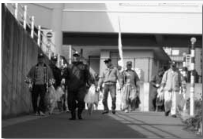
10月19日(水) / シルバーの日『社会奉仕活動』