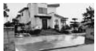
金谷 A様宅 消雪工事完成

ボーリング(井戸)工事をして消雪すると、経費はほんの少しの電気代のみ。これからの高齢化社会も安心です。雪片付け不要になりますヨ! ます、ご相談下さい。