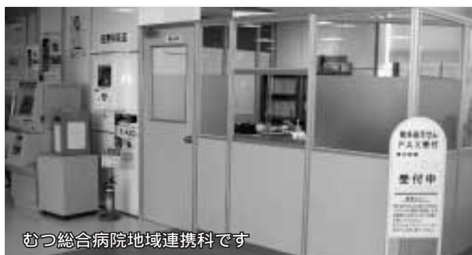
むつ総合病院地域連携科です

(詳しくは) 市健康推進課 電話2-1111 内線443・445 川内庁舎健康福祉課 電話42-2111 大畑庁舎健康福祉課 電話34-2111 内線181・182 脇野沢庁舎健康福祉課 電話44-2111