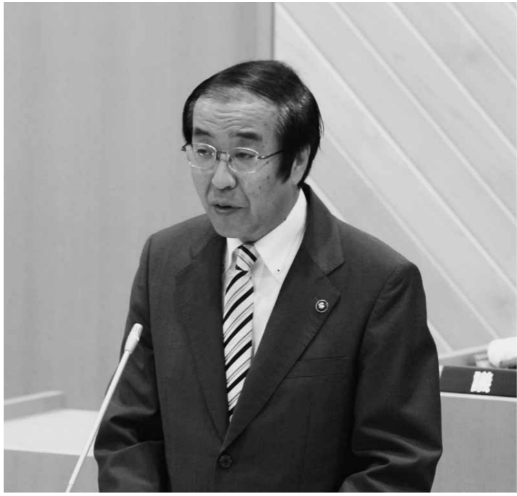
8月1日、むつ市議会第147回臨時会で就任のあいさつを述べる

7月10日に行われたむつ市長選挙において、宮下順一郎市長が再選されました。2期目のスタートを迎え、市政運営に取り組んでいくに当たっての決意を述べました。