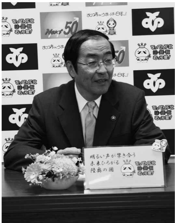
2期目初の記者会見にて意気込みを語る