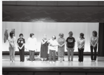
(写真右上)ビューティフル・フラ・むつハーラウによる発表