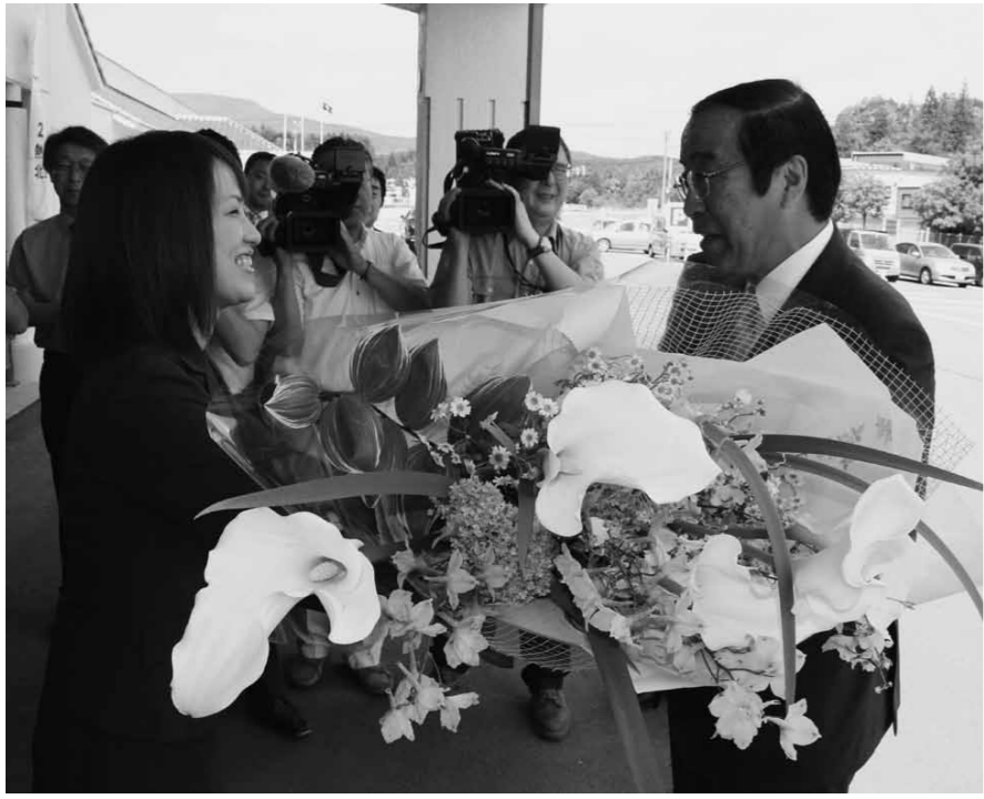
7月11日、初登庁の際、女性職員より花束で出迎えを受ける