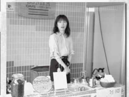
(写真上)コーヒー通り 21