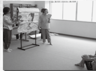
(写真上)おはなしひばの会