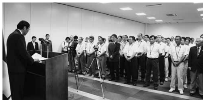
職員へ訓辞を述べる宮下市長

基盤づくりと飛躍」では、「むつ市のうまいは日本一」のキャッチフレーズのもと、ムチュランやムチュリーなどの応援も得て、これまでも力を入れてまいりました第一次産業の振興とともに、地域内に数多くある観光資源を整備・充実させることで、その魅力にさらに磨きをかけ、交流人口の増加に繋げてまいりたいと考えております。 また、道路整備等市民生活に直結する事業はもちろんのこと、文化財・歴史資料等展示施設の設置や電気自動車導入事業など新たな施策にも積