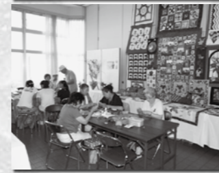
(写真上)ちりめん人形サークル (写真下)パッチワークサークル