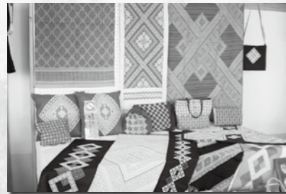
(写真左)こぎん刺しサークル