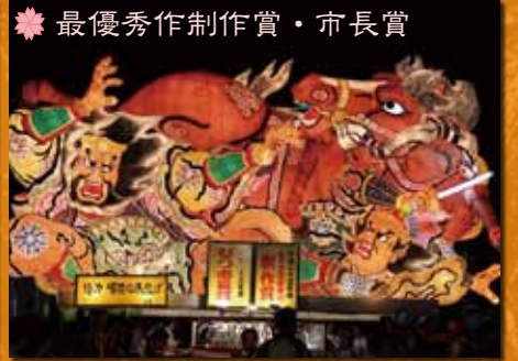
❁ 最優秀制作賞・市長賞