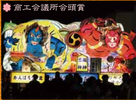
❁ 商工会議所会頭賞