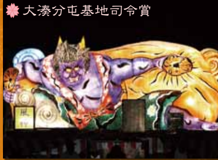
❁ 大湊分屯基地司令賞