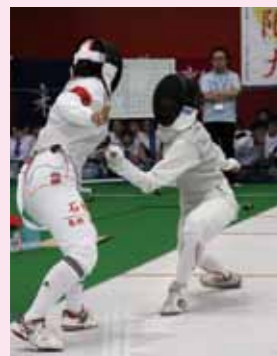
女子団体(田名部) 1回戦 5-0 安来(島根) 2回戦 4-5 揖斐(岐阜)