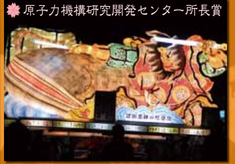
❁ 原子力機構研究開発センター所長賞