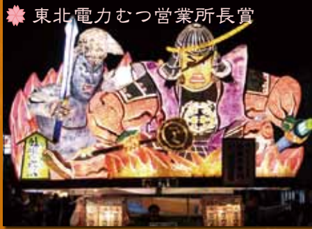
❁ 東北電力むつ営業所長賞