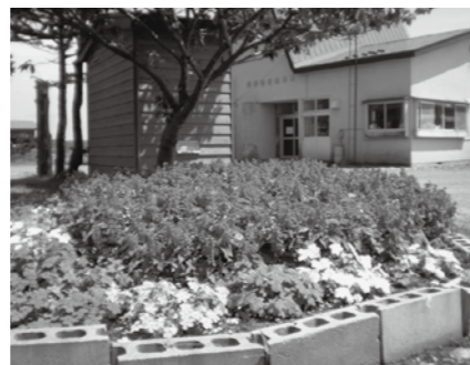
蛸崎地区公民館の花壇

川内地区に14か所ある地区公民館の花壇や、国道338号沿いには、地域のみなさんによって手入れされた花がきれいに咲いています。