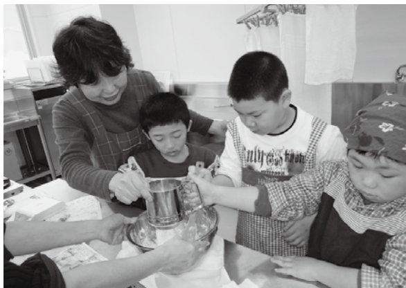
おいしくできるかな？クッキー作り

放課後子ども教室の先生役は、子どもたちの保護者や祖父母世代の方、元教員の方など、地域住民のみなさんです。子どもたちは宿題をするほかに、お菓子作りや昔の遊び、野菜栽培や自然探索など、住民のみなさんの指導のもとでさまざまな体験をしています。