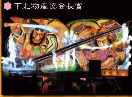
❁ 下北物産協会会長賞