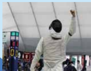
男子団体(田名部) 1回戦 0-5 富山西(富山)