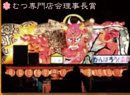
❁ むつ専門店会理事長賞