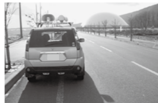
避難をするときは、キーを付けたままドアロックをしない。

ハンドルをしっかりと握り、徐々にスピードを落として車を左側に止め、エンジンを切りましょう(急ブレーキは絶対に避ける)。冷静に周囲の状況を観察しながら、ラジオをつけて正確な情報を収集しましょう。避難するときは、キーをつけたままドアロックをせずに車を離れましょう(車検証や貴重品は忘れずに持ち出す)。