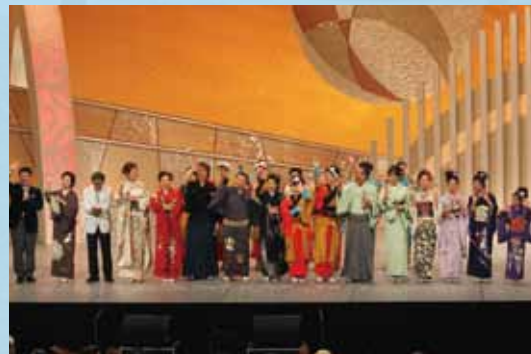
大盛況のうちに番組収録は終了