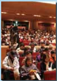
たくさんの観客が 開場前から行列を作っていました