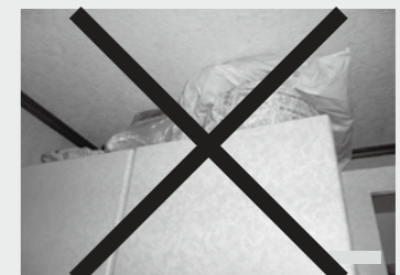
家具の上に、重いものや壊れやすいものを置かないようにしましょう。