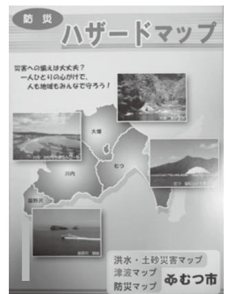
いま一度、「防災ハザードマップ」で避難場所を確認しておきましょう。