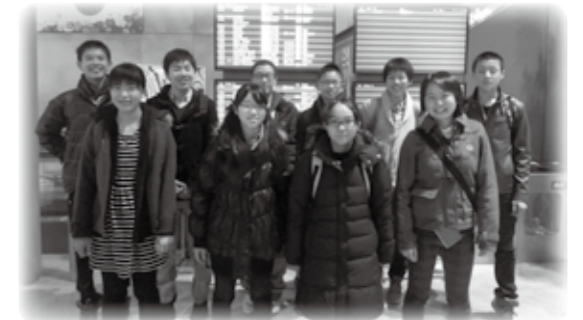
平成 25 年度ジュニア大使のみなさん

〈問合せ・申込み先〉 市教育委員会学校教育課指導担当 ☎ 22-1111 内線 3136