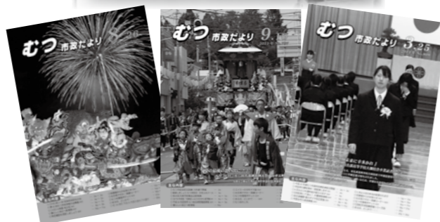
〈メールモニターへは次の方法で登録できます。〉