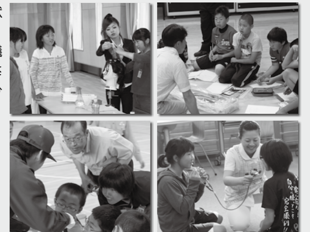
平成25年度開催のユメココ教室