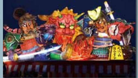
海上自衛隊ネブタ祭り実行委員会 『大江山 酒呑童子』