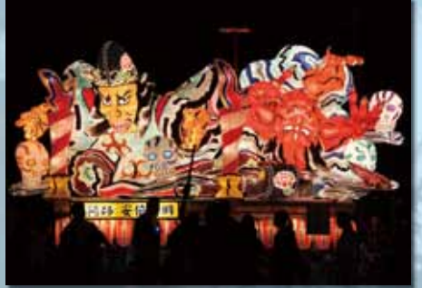
むつ市職員互助会 『陰陽師 安倍晴明』