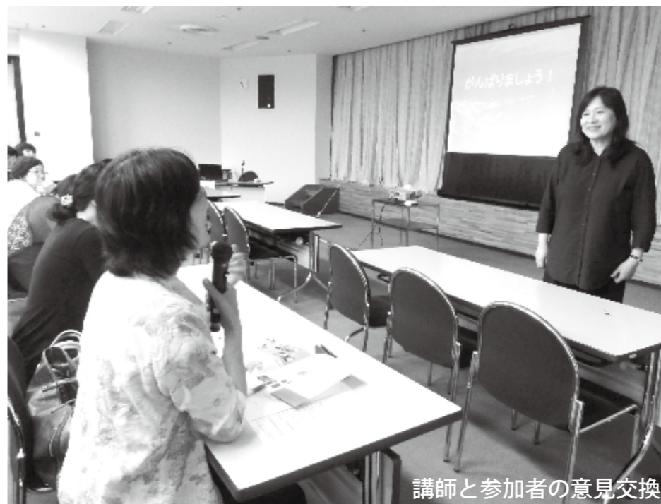
講師と参加者の意見交換