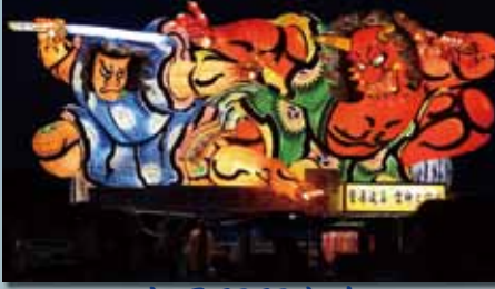
山田町町内会 『菅原道真 雷神と化す』