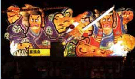
桜木町町内会 『巖流島』