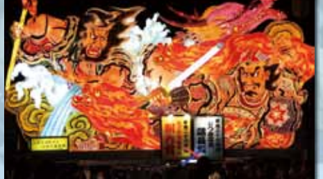
大湊上町町内会 『水滸伝よりの入雲龍公孫勝と混世魔王樊瑞』