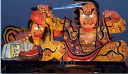
大湊浜町町内会 『水滸伝～林冲王倫を討つ』