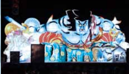
川守町町内会 『不動明王』