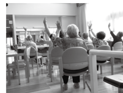
生きがい活動支援通所の様子