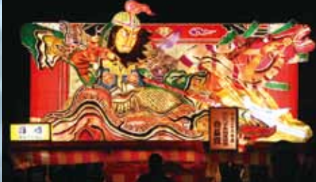
宇田町町内会 『高順』