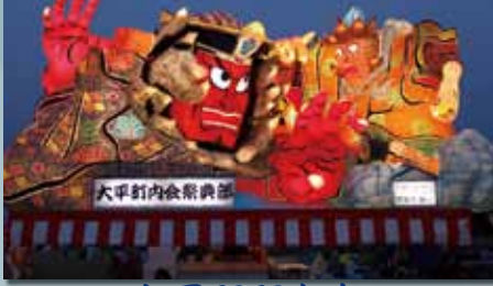
大平町町内会 『孫悟空』閻魔庁を騒がす』