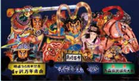
城ヶ沢俊武多実行委員会 『飛将呂布』