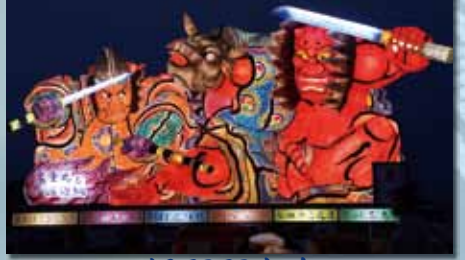
旭町町内会 『鬼童丸と渡辺綱』