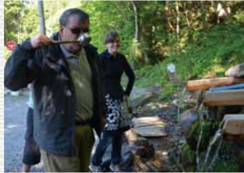
右/田名部高校で別れを惜む生徒 下/冷水でダン・ディ・ジュリオ市長