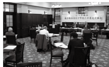
北の防人大湊安渡館(5月28日)