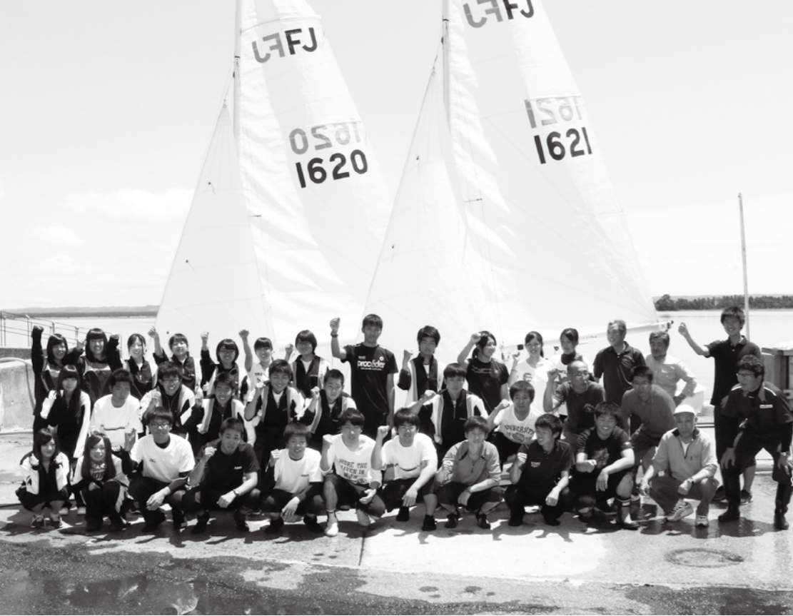
7月5日、清掃活動に参加したみなさん

連載5回目の今回は、「むつヨットクラブ」と「大湊高校ヨット部」のみなさんをご紹介します。むつヨットクラブは、昨年創設50周年を迎えました。現在は40名ほどで活動し、そのメンバーは大湊高校ヨット部OBのみなさんが中心で、元顧問の先生も入っています。