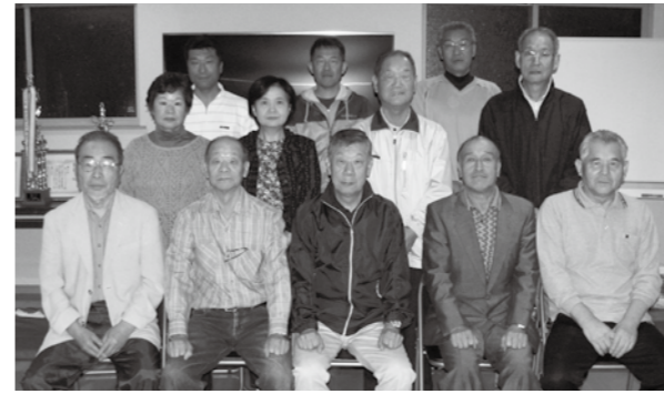
町内会のみなさん

緑ヶ丘町内会は、下北文化会館のある金谷二丁目の北側に位置する新興住宅地にあります。ここは昭和62年に組織された比較的新しい町内会で、約270世帯が会員となっています。平成14年に町内会名義で不動産登記ができる認可地縁団体となり、平成23年12月にはコミュニティ活動の拠点として「緑ヶ丘コミュニティセン