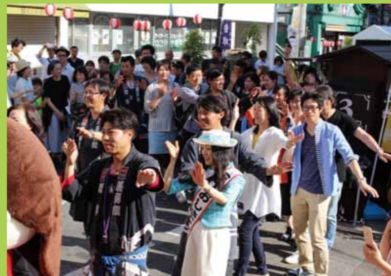
上/亀戸のみなさんと一緒に輪になっておしまこ踊り。下/スタートは関乃井の鏡開きから、その後、みなさんに振る舞い

今年で4年目の開催となる「むつ市のうまいは日本一! in 亀戸」むつとの遭遇」が東京都江東区の「亀戸香取勝運商店街」で行われました。 4回目の開催ということもあり、地元江東区のみならずむつ市出身の方にはすっかり馴染みとなったこのイベントですが、毎年パワーアップをはかり、今年はNHKみんなのうたにも楽曲が選ばれるなど大活躍のSinonさんも登場し、盛