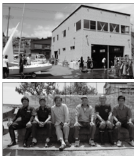
上/クラブハウス 下/むつヨットクラブのみなさん ※FJ級、420級はヨットの種目

大湊高校ヨット部は、現在部員40名の大所帯となっています。今年も東北大会を勝ち抜き、8月に和歌山県で行われるインターハイにFJ級で男女出場、420級でも男子が出場を決めました。今は、インターハイでの入賞を目指して、最後の追い込みの時期となっています。休みの日には、午前9時から午後5時まで練習に励みます。いずれの種目も2人乗り種目で、選手