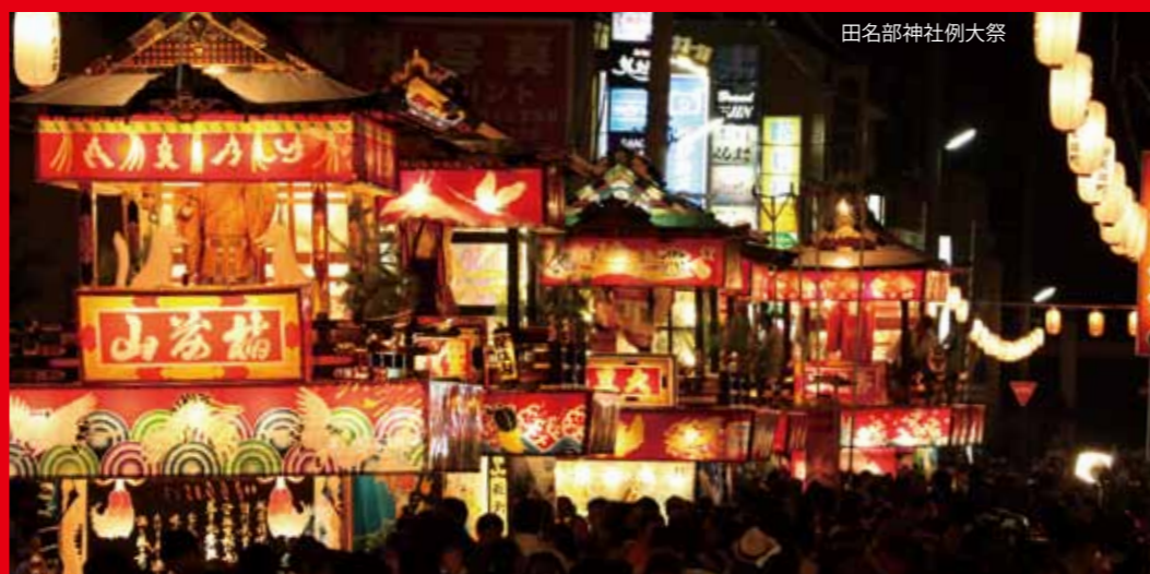
田名部神社例大祭