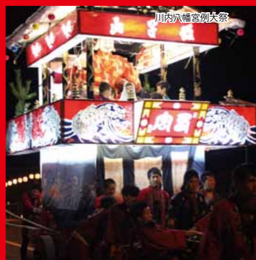
川内八幡宮例大祭