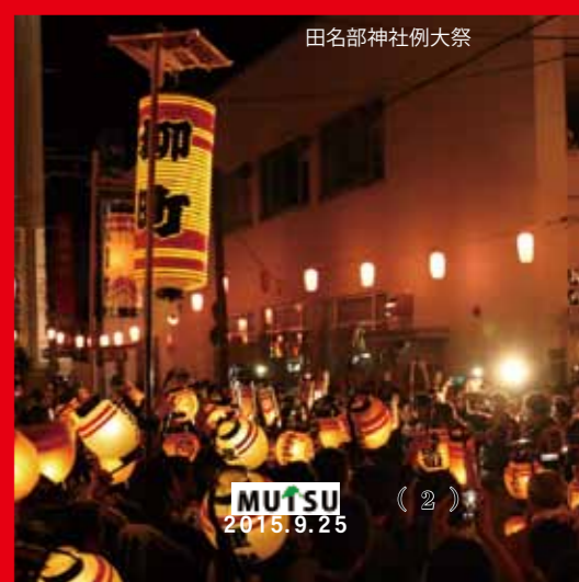
田名部神社例大祭