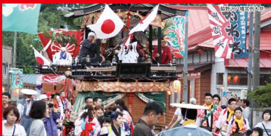
脇野沢八幡宮例大祭