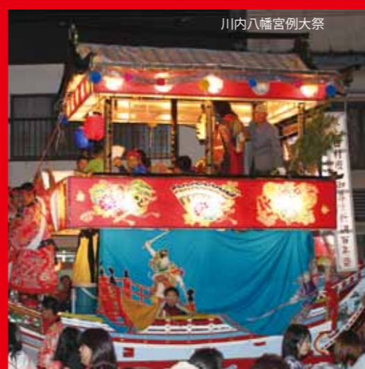
川内八幡宮例大祭