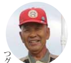
連載7回目の今回は、ウエルネスはらつばるなどいろいろな汗をかいているむつグラウンド・ゴルフ

協会のみなさんを紹介します。 協会は、平成14年に20数名で発足し、現在は、むつ地区、川内地区を合わせて約90名の大所帯となり、80歳以上の方も多く所属しています。