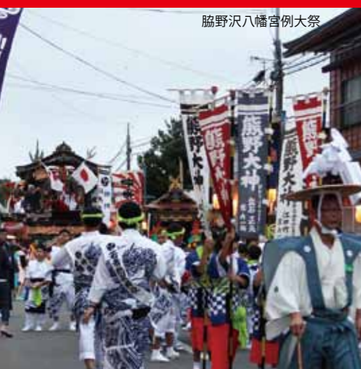
脇野沢八幡宮例大祭

これらに基づき、人口減少に歯止めをかけ、将来にわたって活力ある地域社会の維持・発展につながる「まち・ひと・しごと創生」の取組を進めます。