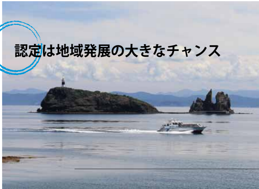
田村麻呂伝説が残る脇野沢の鯛島