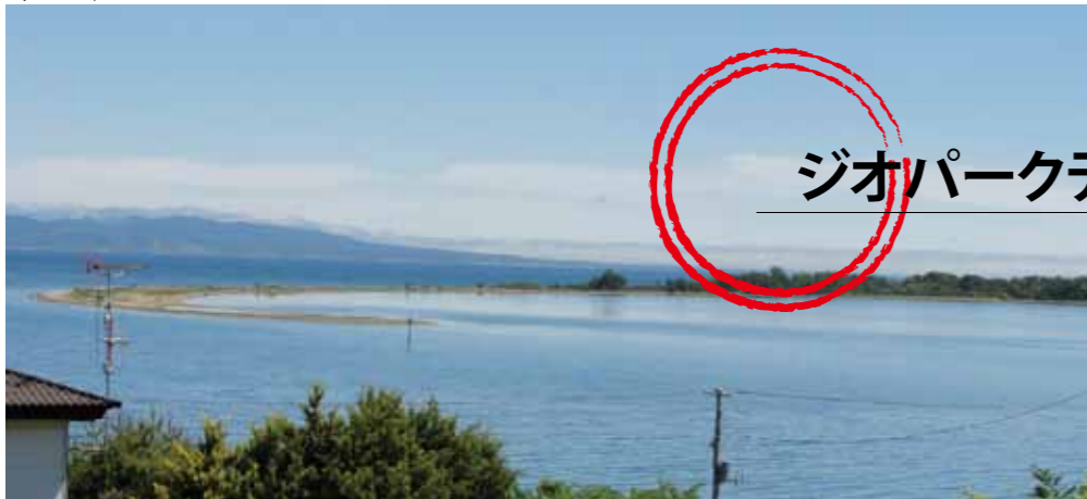
芦崎の砂嘴、大湊のシンボル