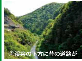
②溪谷の下方に昔の道路が