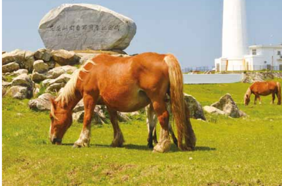
尻屋崎の灯台と寒立馬