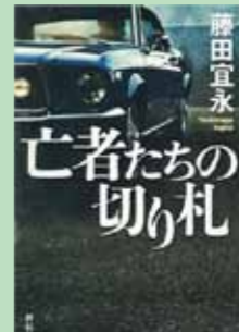
『亡者たちの切り札』

誰もが踊り狂ったバブルの果て、友はなぜ、その手を汚した? 拉致、殺人、不正融資、政界の闇…。ハードボイルドの旗手が放つ、渾身の犯罪サスペンス!