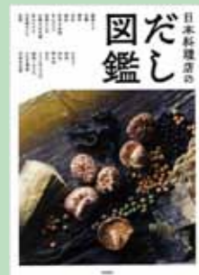
『日本料理店のだし図鑑』

だしの素晴らしさと活躍の幅の広さを伝える図鑑。だしがどんなものであり、どのような使い方ができるのか、日本料理店やそばうどん店のレシピとあわせて紹介する。