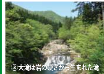
③大滝は岩の硬さから生まれた滝

す。よく見ると大滝の上流と下流で岩石が変わっています。岩の硬さが滝を作ったのです。 ④安部城鉱山は大正期に繁栄した鉱山ですが、深刻な鉱害も。当時は辺り一面、草木一本も生えないほど、自然が破壊されましたが、住民の努力により、豊かな森が復活しました。