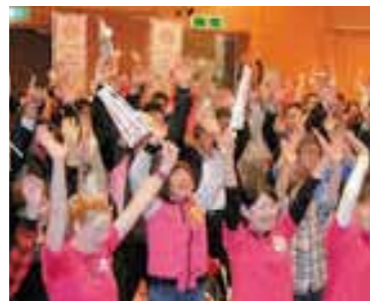
昨年、世界ジオ認定を受けたアポイ岳の様子みんなうれしそうです!

また、下北の素晴らしい地域のみならず、誰もが下北の良さを語っていくようになることで、今まで以上に魅力的な下北が生まれ、それが結果的に観光客を呼び込み、収入のアップにつながります。 ジオパークには終わりというものはありませんので、50年、100年先までつづく魅力ある下北づくりにつながっていくのです。