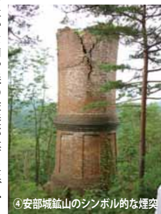
④安部城鉱山のシンボリックな煙突

す。よく見ると大滝の上流と下流で岩石が変わっています。岩の硬さが滝を作ったのです。 ④安部城鉱山は大正期に繁栄した鉱山ですが、深刻な鉱害も。当時は辺り一面、草木一本も生えないほど、自然が破壊されましたが、住民の努力により、豊かな森が復活しました。