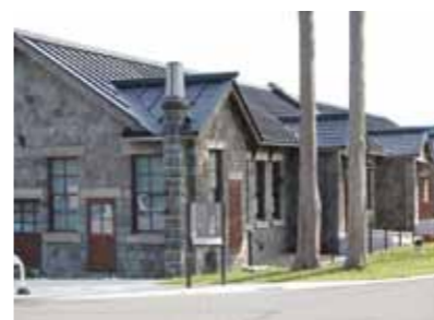
北の防人大湊式番館