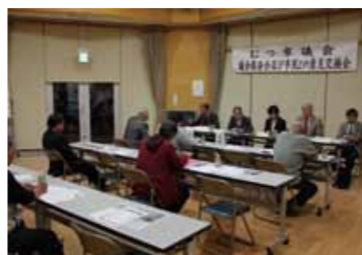
脇野沢地域交流センターでの様子