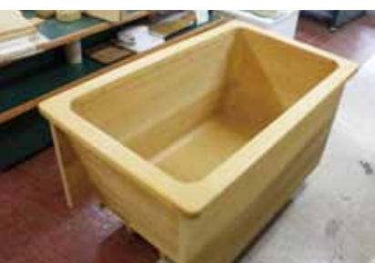
今年が目玉! 青森ひば浴槽(100万円以上の寄附)