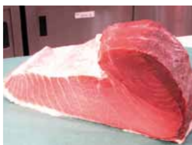
津軽海峽産まぐろ