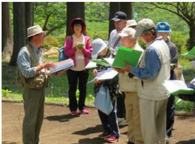
ボランティアガイド養成講座の様子

北の防人大湊 ボランティアガイド始動! 5月から実施してきたボランティアガイド養成講座が終了し、いよいよ8月から活動します。 このガイドでは、重要文化財旧大湊水源地水道施設をはじめ、大湊・海軍の歴史、大湊・芦崎ジオサイトについて、3つのコースから選び、学ぶことができます。また、式番館を発着とし、北洋館、みどりのさきもり館、安渡館、海望館の各施設を巡るもので、土・日・祝日や周辺施設でのイベント開催時にガイドをします。(団体の場合は要申込み) それ以外の平日でも学校の課外授業や、職場・町内会等の研修・交流会としてもご利用できますので、ぜひお問い合わせください。