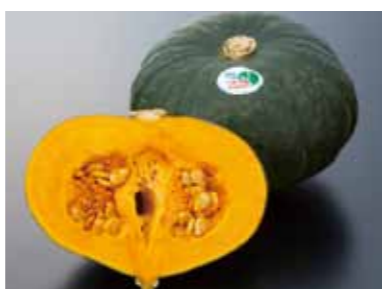
一球入魂かぼちゃ