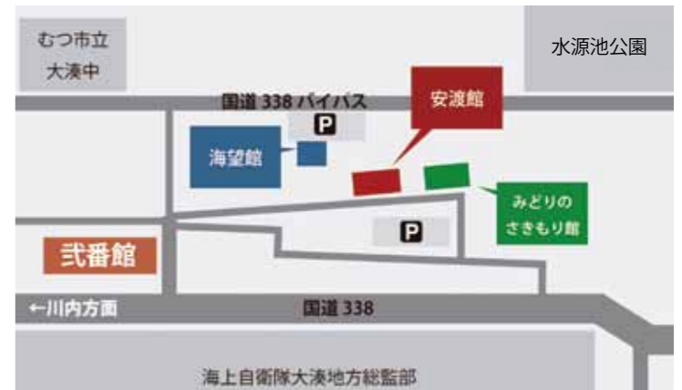
式番館駐車場混雑時は安渡館駐車場をご利用ください。