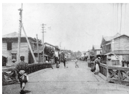
電気が誕生した頃の本町の町並み