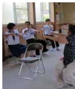
意外と大変!! みなさんスゴイ!

昭和町B町内会のみなさんは、むつ市の「いきいき百歳体操」パイオニアとして、また、「住民主体」の町内会活動のお手本として、これからも元気もりもり、活動していつてほしいと思います。