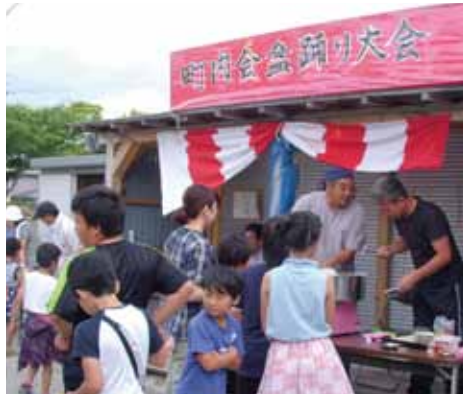
夏まつりは子どもたちで賑わいます

はじめませんか？ あなたの地域でもいきいき百歳体操 町内会・サークル・ご近所の仲間とおしで。みなさんのヤル気をサポートします！ ☎ 22-1111 内線 2565