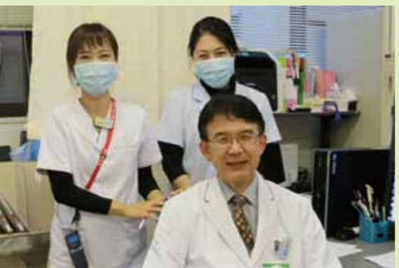
放射線科外来で看護師さんと