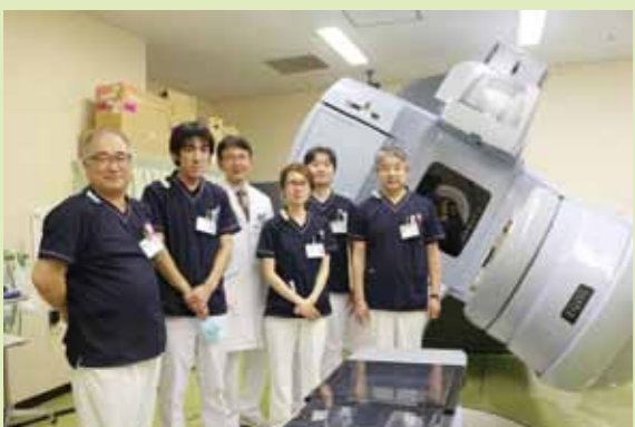
放射線照射の大型機械の前で技師のみなさんと