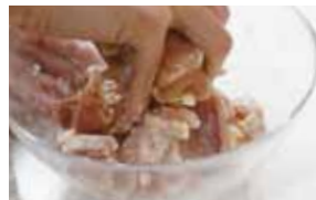
①ブロッコリーは小房に。鶏肉は余分な脂を取り除き一口大に切り、Aを順にもみ込む。