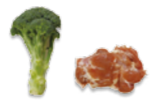
鶏肉とブロッコリーのカレー炒めは、ヘルシーバランス弁当「緑黄色野菜たっぷり弁当」の一品です。

材料(お弁当4人分) ブロッコリー 60g 鶏もも肉 180g バター 4g にんにくすりおろし 1g A: 塩 1g・小麦粉 3g B: カレー粉 2g・水 10cc しょうゆ 2g・塩 1g 1人分栄養価 108kcal 塩分 0.6g