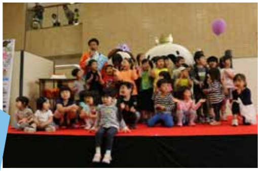
イベントではみんなでムチュランの誕生日をお祝いしました。