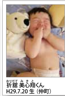
おりだて みきと 折館 美心翔くん H29.7.20 生 (仲町)