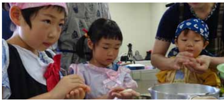
まますおにぎりキッチン 《おにぎりづくりを通じて下北の幸について知ろう》