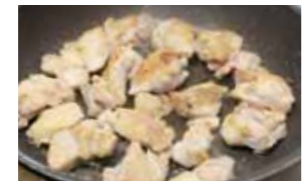
②フライパンにバターとにんにくを入れ中火で熱し、香りがたったら鶏肉を皮目から焼く。焼き色がついたら裏返しさらに2〜3分。