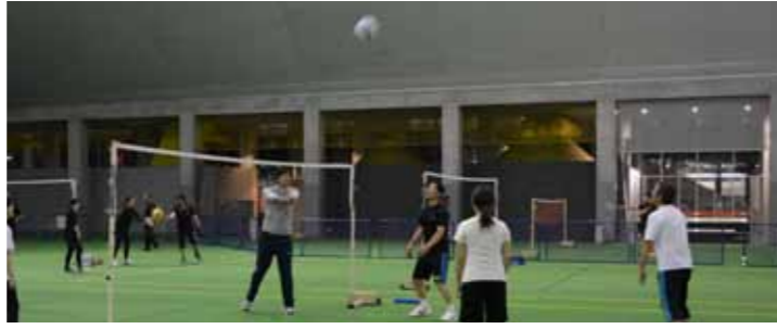
市民スポーツ教室 《運動不足解消に、仲間作りに》

市民スポーツ教室 《運動不足解消に、仲間作りに》 市民スポーツ教室 《おにぎりづくりを通じて下北の幸について知ろう》