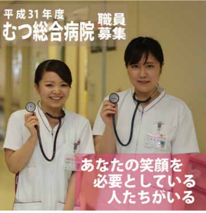
むつ総合病院平成31年度職員採用試験 《むつ総合病院で働く職員を募集しています。》