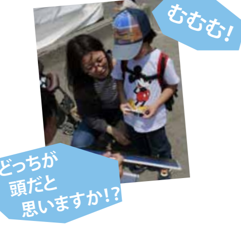
どっちが頭だと思えますか!?

なんと、約7割の方が「あたまは陸奥湾」としているという結果に。しかし、津軽海峡側があたまだと思っている方の理由もなかなか一理あります。 今回のアンケートは、決して答えを出すことが目的ではありません。今後ブームが到来するかもしれないひかりのアゲハ!! まだまだ「あたまはどっち」議論は深まりそうです!