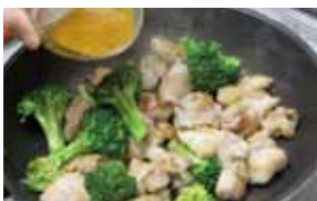
③ブロッコリーとBを加えて、炒め合わせれば完成。