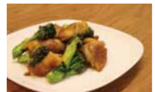
④茹でないブロッコリーがシャキシャキで栄養満点！カレーの風味で味も大満足です。

ヘルシーバランス弁当 いかがですか？ むつ市健康づくり推進課では、カロリー抑えめなのに大満足なお弁当のレシピを紹介しています。バランスの良い食事のために、メニューに取り入れてみてはいかがでしょうか。また、市内にヘルシーバランス弁当を製造、販売していたりしているお店があります。健康づくりの一つにお役立てください。