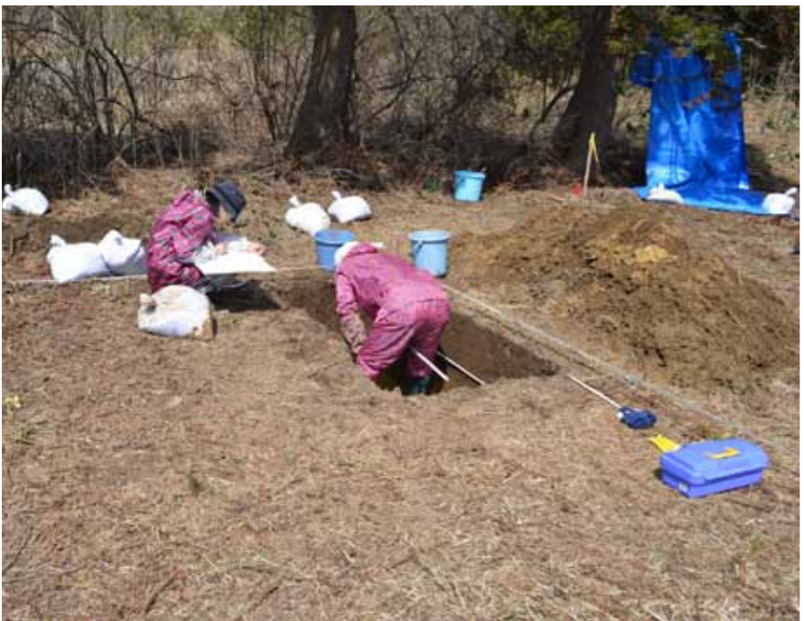
遺跡の発掘調査作業員に登録してみませんか （写真遺跡の発掘調査作業をしている様子）