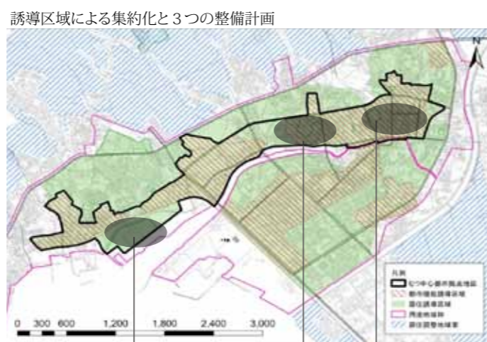
先端高齢者医療と子育てエリア 【金谷地区都市再生整備計画】 臨海公園とスポーツエリア 賑わいと稼ぐエリア 【大湊居住誘導地区都市再生整備計画】 【田名部まちなか地区都市再生整備計画】

このことから、市は、今ある「まち」を持続しながら市民の生活利便性を向上させるため、市内の複数のまちを人口密度を維持する拠点として位置づけ、その複数の拠