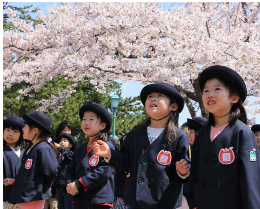
花咲か大作戦 2018 夏の陣募集。来年の春もたくさんの桜の花を咲かせたいね。〈多くのご参加お待ちしております。〉