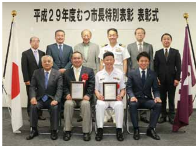
平成29年度むつ市長特別表彰 表彰式