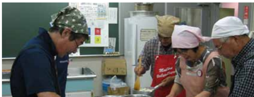
男性のための料理教室 《食生活改善推進員が教えます!》