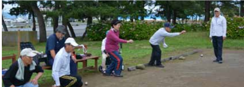
市民スポーツ教室 《運動不足解消に、仲間作りに(写真はペタンク教室の様子)》