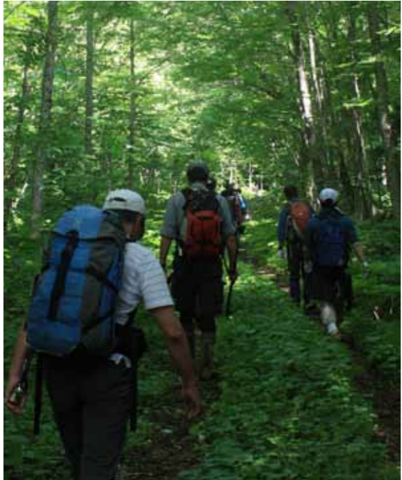
山かけ登山に参加しませんか 《普段できない体験と絶景が楽しめます》

認知症・寝たきりにならないために (いつ)どこで) 8月14日(火)・むつ来ささい館 8月16日(木)・大畑公民館 いずれも午前11時～正午 (定員・参加費)40名・無料 知って安心 麻酔のあれこれ (いつ)8月18日(木)午前11時～正午