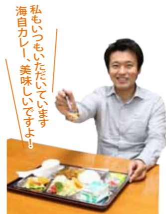
特集 大解剖!!これが大湊海自カレーだ おわり

大湊海自カレー普及会の監修による絶品カレーパン! 7月31日から東北各県で販売開始。ご期待ください!!