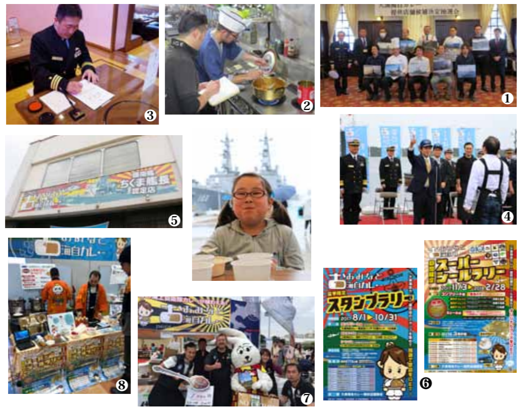
①提供店舗候補決定抽選会。この日、各店舗がどの部隊のカレーを提供するか決定した。②秘伝のレシピはすべて「忠実に」引き継がれた。③提供されるカレーはすべて艦長や司令たちの認定を受けている。④平成29年6月10日の「大湊海自カレー出港セレモニー」。翌日から各店舗で提供開始。⑤それぞれの店舗のアイデアによって、大湊海自カレーはPRされる。⑥普及会のアイデアにより開催された参加型イベント。より多くの店舗の味を楽しみむきかけになった。⑦よこすかカレーフェスティバル2018に出店。全国のカレーファンに魅力を伝えた。⑧こちらはあおもりカレーまつりの様子。まずは県内での認知度を高めたい。