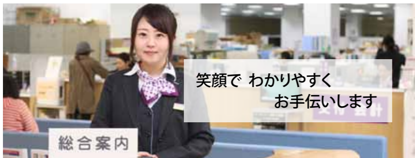
平成 31 年度窓口サービス専門員募集 《むつ市役所は、市民のみなさまに親しまれ、信頼される明るい市役所を目指します》