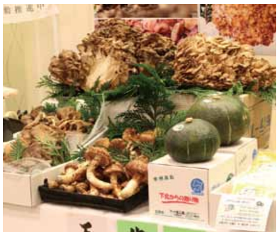
(左) 下北カンブリア農場が出品した天然キノコ。なかでも大型の舞茸や松茸が来場者の注目を集めた。 (左下) 宮下市長も松茸を両手に料理関係者へむつ市の特産品のPR。