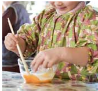
親子の料理教室 《食生活改善推進員会主催の料理教室。お気軽にご参加ください》