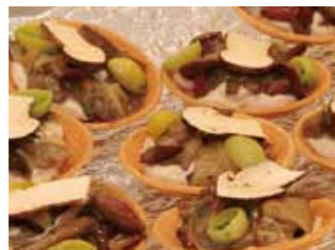
(上) 商談会ではホテルグランヴィア大阪のシェフたちによってむつ市の食材が調理され、実際に味わいながら商談ができる。 (下) 「下北の天然キノコのタルト」は来場者に好評だった。