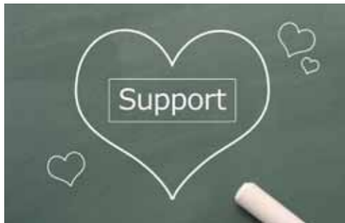
スクールサポーター・自立支援相談員募集説明会 《子どもたちや保護者のみなさまの悩みに寄り添い、教育活動全般を支援する大切なお仕事です》