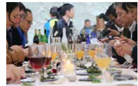
(上) 各有名店のシェフが共同でひとつの料理を作る奇跡の時間。 (下) テーブルの上には創作料理が並びグルメ雑誌や旅行雑誌などメディア関係者の舌をうならせた。