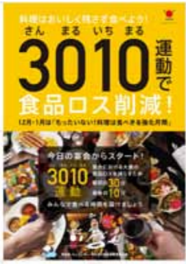
忘年会・新年会の時期 目指せ食品ロス削減!