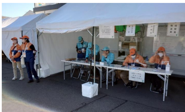
ウィンドブレーカー、帽子（鹿児島市）