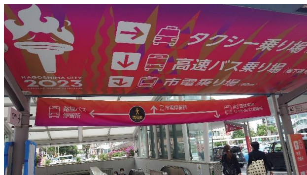
交通機関案内看板（鹿児島中央駅）