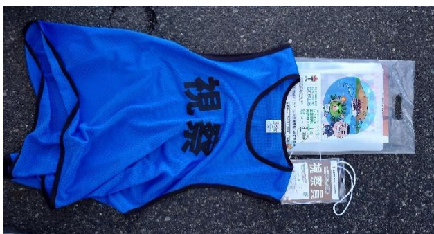
視察員用バスト（鹿児島市）