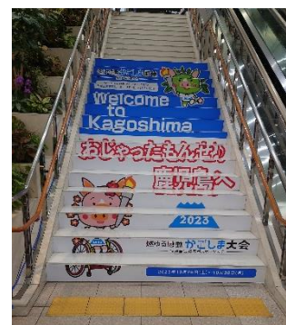
階段装飾（鹿児島空港）