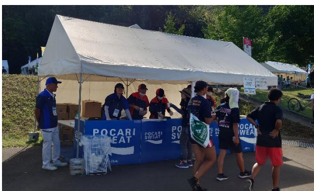
バスト、帽子（鹿屋市）