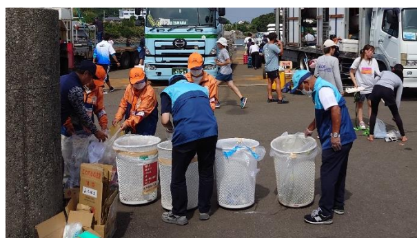
環境美化（鹿児島市）