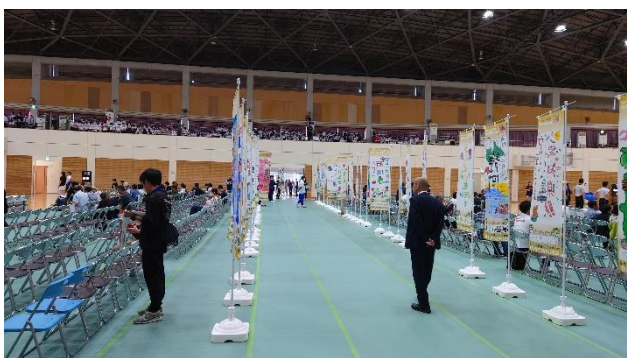
手作りのぼり旗（始良市）