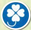
しんたいしょうがいしゃやむようし 身体障害者標識 (四葉のクローバーマーク)