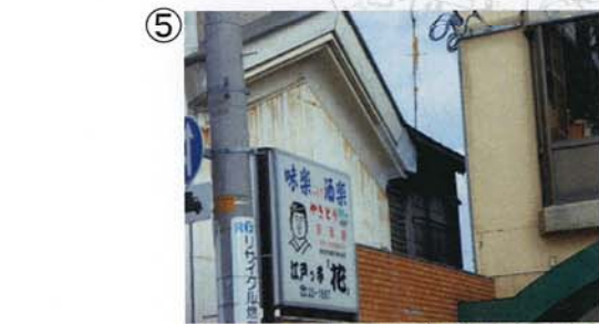
⑤ ヤマショウ商店。蔵を活用した商店。田名部繁栄のおもかげ。