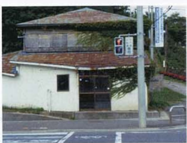
① 空き家のガラスが割れていて危険。