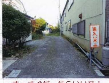
⑪-2 まっすぐだったらいいな！