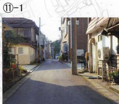
⑪-1 代官山が見えていい感じ。でも、電柱が…。圧迫感を与える。