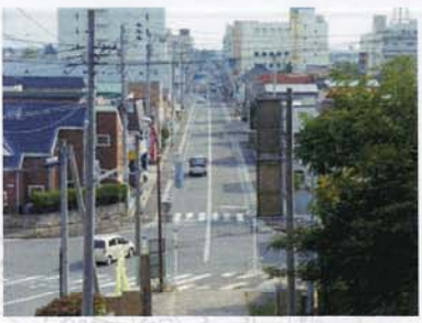
① 本町通りが真っすぐ続く景観がいい。看板がジャマ。