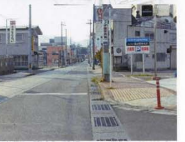
⑭ 他の地区とのギャップが大きい。