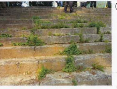
① 階段にヒビが…。草も…。