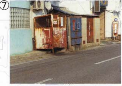
⑦ 今は綺麗だけど、朝はひどい眩がアス。