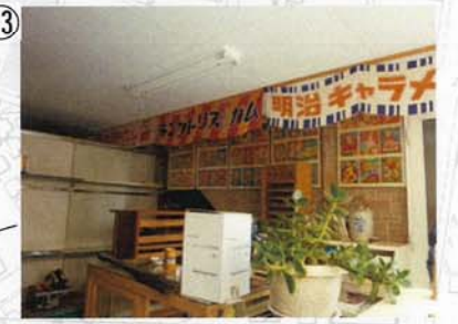
⑬ こっちが昭和七福通りという思いで展示コーナーだという思いでやっています。明神町昭和館だ。