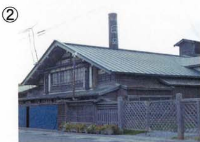
② 関乃井酒造。本州最北端の蔵元である。