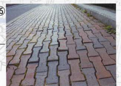
⑮ レンガがでこぼこしていて歩きにくい。車イスも動きづらい。