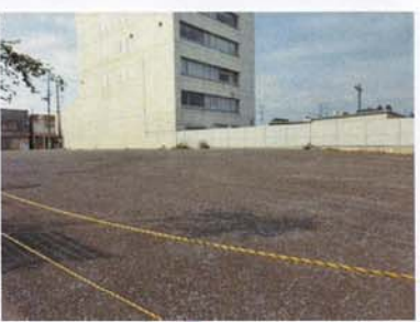
① 空き地を整理して、公園や緑地してほしい。