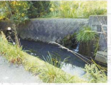
⑫ 明神川。毎年人が落ちる。