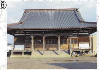
⑧ 常念寺本堂。御本尊が国の重要文化財に指定