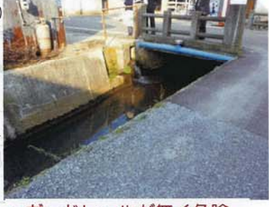
⑫ ガードレールが無く危険。