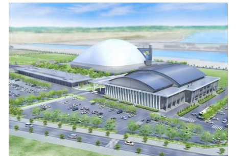
総合アリーナとウェルネスパーク・克雷ドーム