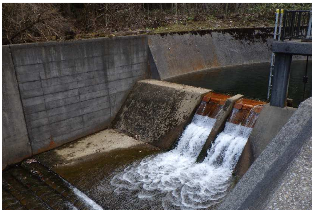
宇曾利川浄水場の取水施設