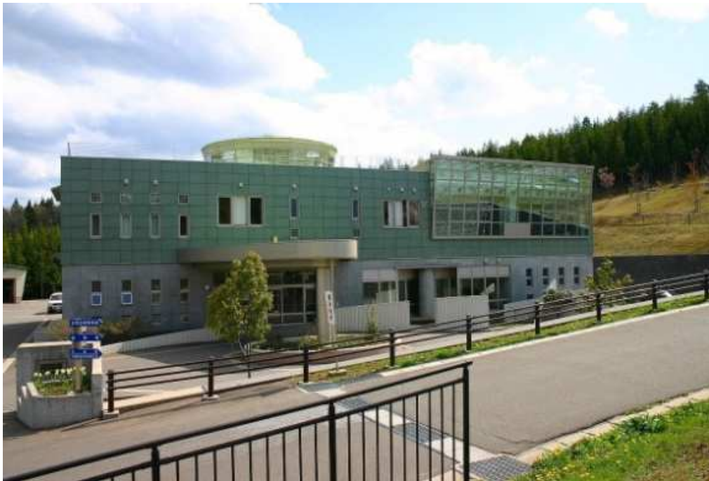
上水道管理センターの全景