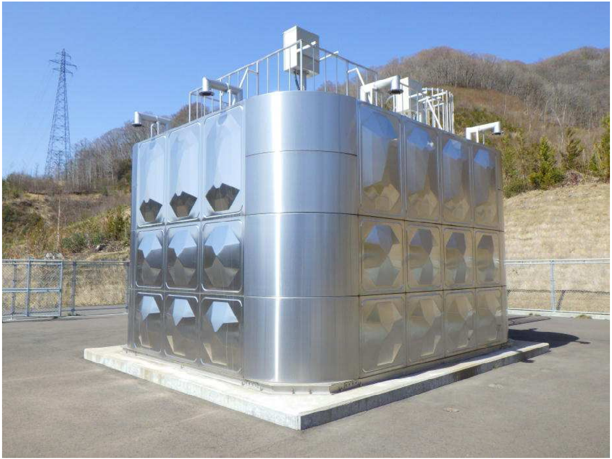
畑配水場の配水池