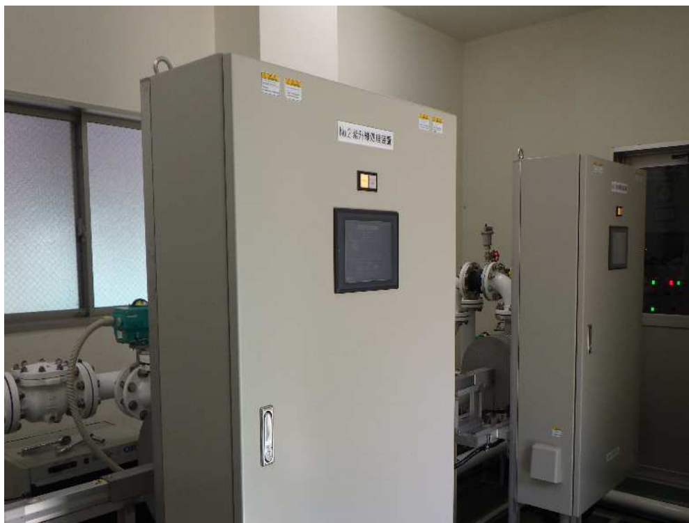
木野部浄水場内の紫外線処理設備