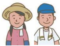
農地利用最適化推進委員

農業委員会が定めた区域ごとに委嘱します。 地域内の「農地利用の最適化の活動」を主に取り組みます。