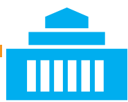
議会同意を経て任命