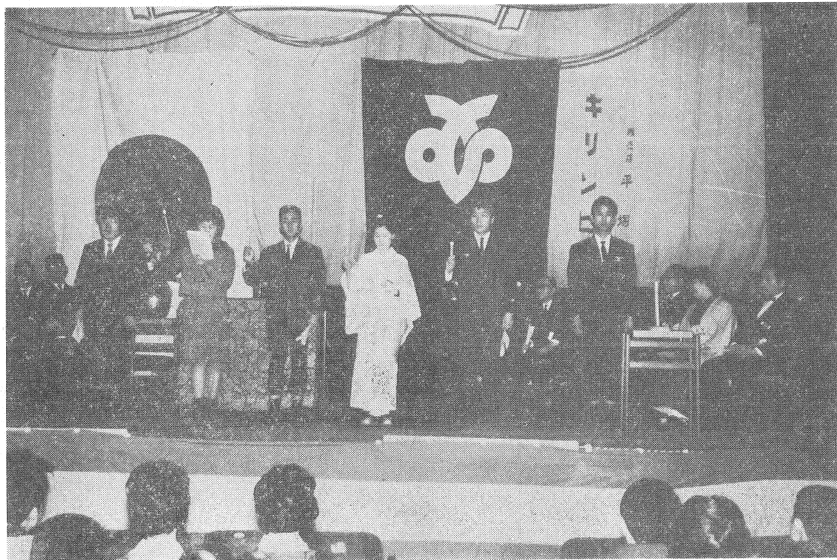
① 誓火をかざし、誓いのことをのべる代表たち