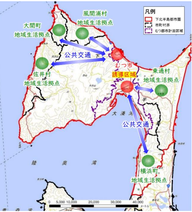
誘導区域と地域生活拠点の連携イメージ