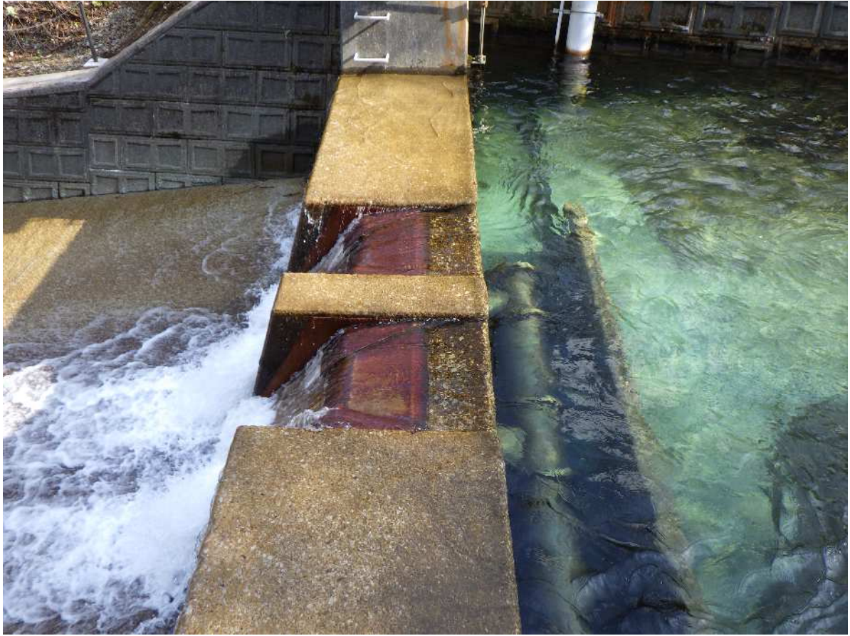
大荒川取水所の取水施設