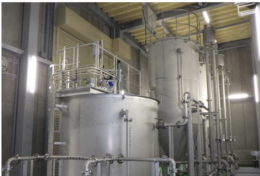
八木沢浄水場の前処理施設