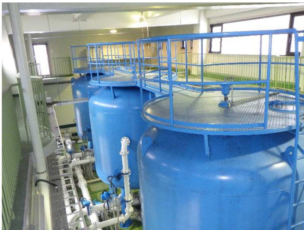
田名部浄水場内の急速ろ過設備

湧水の場合も、水質は良好で年間を通じて安定していますし、取水地点近傍には水質を汚染する可能性のある施設がないことから、外的要因による水質汚染の可能性は低く、優良な水源であるといえます。ただし、過去に木野部浄水場の水源からクリプトスポリジウム等の指標菌が検出されたため、これに対する浄水処理を行っています。このような原水の状況を踏まえて、今後もより良質で安全な水を送るよう努めます。